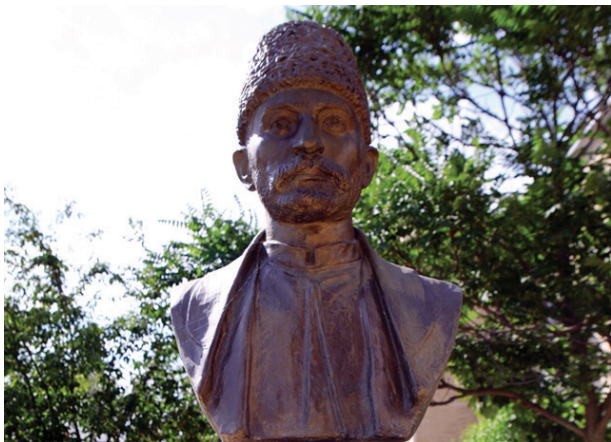
Бюст Сеид Азима Ширвани на территории историко-краеведческого музея в Шамахи

О Сеид, пойми глубоко суть написанной газели: Быть гулякой и харчевни часто посещать не надо!