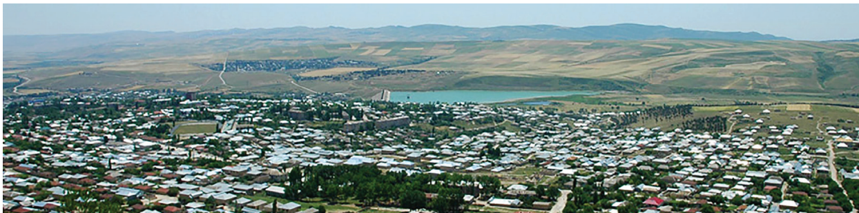
Город Шамахи – родина поэта

образования дед отправил его за границу, и Азим учился в Багдаде, Каире, Дамаске , посетил святыни мусульманского мира в Мекке и Медине, побывал в Алеппо, Исфахане, Тебризе, Ардебиле, ближе познакомился с духовно-культурной жизнью, видными учёными и поэтами крупных центров Ближнего и Среднего Востока. В 1860 году Гаджи Сеиду Азиму Ширвани был присвоен в Дамаске высокий духовный сан ахунда.