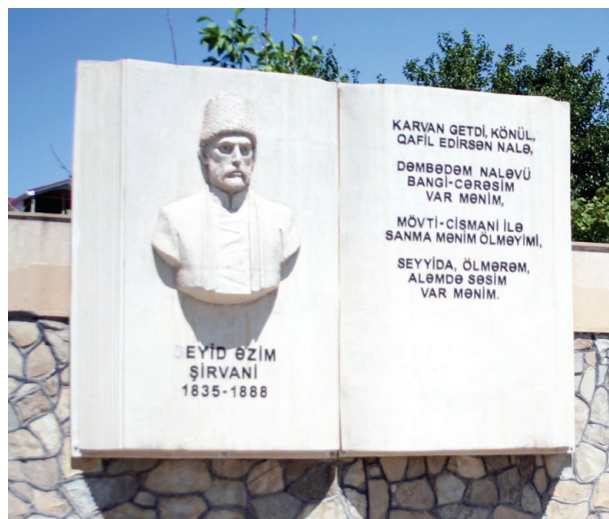
Барельеф с изображением Сеид Азима Ширвани на въезде в Шамахи

Именно в этой школе Сеид Азим встретил своего любимого ученика – будущего гениального азербайджанского поэта-сатирика Мирзу Алекбера Сабира (1862–1911). И сыграл неocenную роль в его личной и поэтической судьбе, как до этого великий лирик Мирза Шафи Вазех (1792–1852) оказал важное влияние на становление мировоззрения основоположника азербайджанской драматургии и просветительской прозы, философа-мыслителя Мирзы Фатали Ахундова (1812–1878).