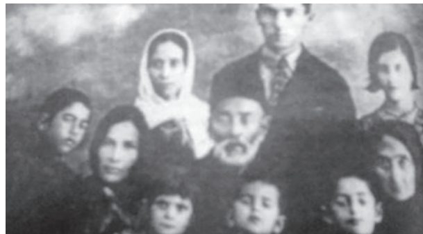
Последняя фотография поэта с членами семьи